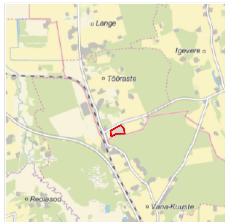
Kaardileht nr 5441 Tartu